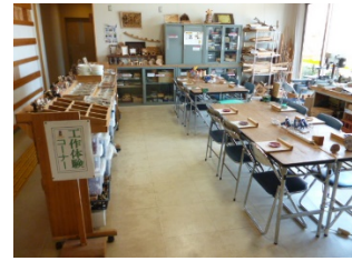
工作体験コーナー

さらに、周辺にも「日本の白砂青松100選」の平砂浦海岸、「日本の道100選」の房総フラワーライン、「日本神社100選」の安房神社があり、魅力ある地域となっています。